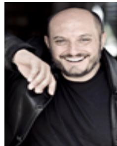
Duccio Camerini https://scuoledicinema.net/2020/03/04/duccio-camerini/